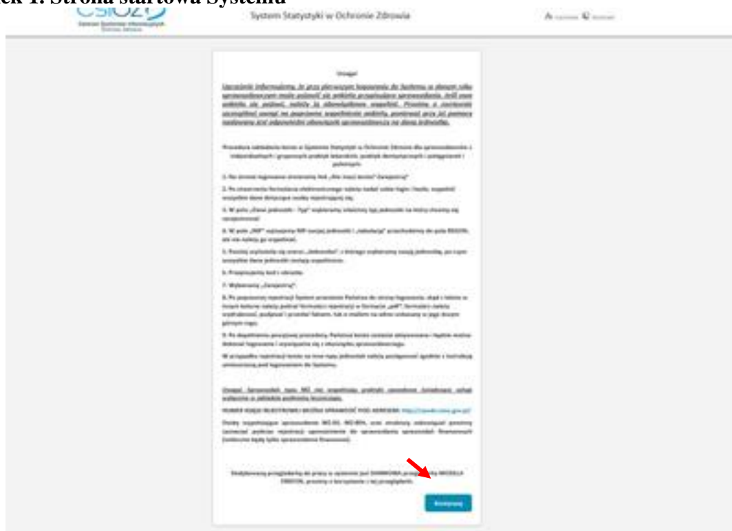
Rysunek 1. Strona startowa Systemu

Proszę kliknąć przycisk KONTYNUUJ na dole komunikatu. Wówczas nastąpi przekierowanie na stronę logowania (Rysunek 2).